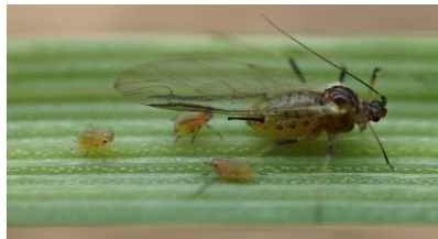
Un puceron ailé et 3 aptères sur céréale.

En annexes vous trouverez : l'aide au comptage du % de levée, le classement variétal de sensibilité au virus Y.